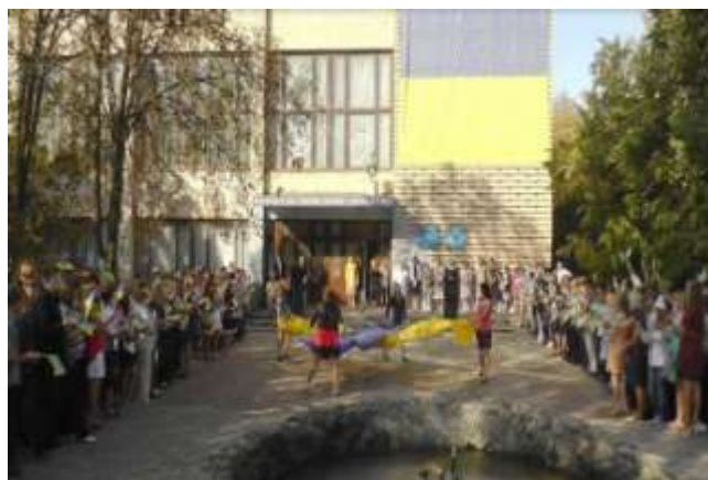
МЦППВ. День Знань