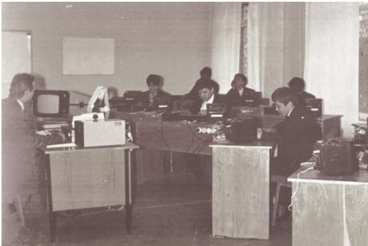
Кабінет ЕОМ. Перші кроки до інформатизації