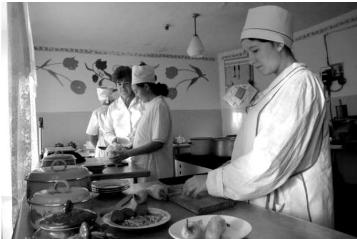
Майстерня з підготовки кухарів