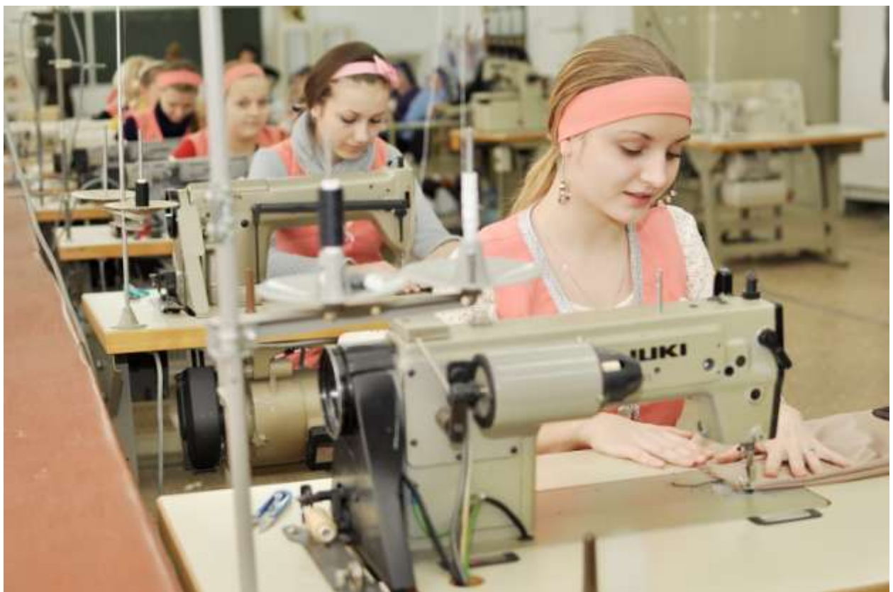
Урок виробничого навчання у сучасній швейній майстерні