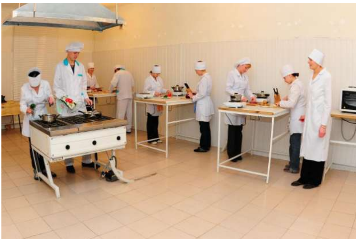
Модернізована навчальна лабораторія з підготовки кухарів-кондитерів