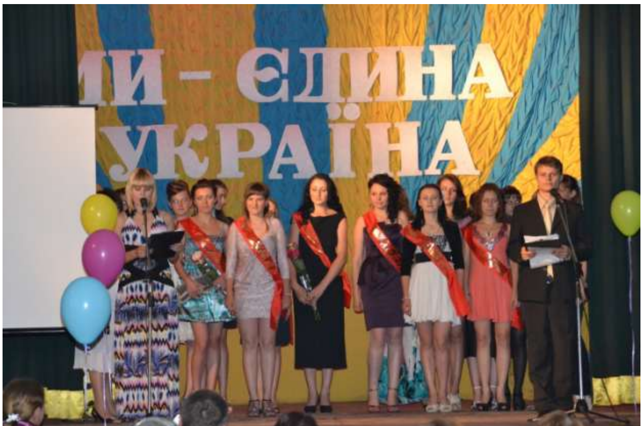
Випускний бал. Нова життєва сторінка