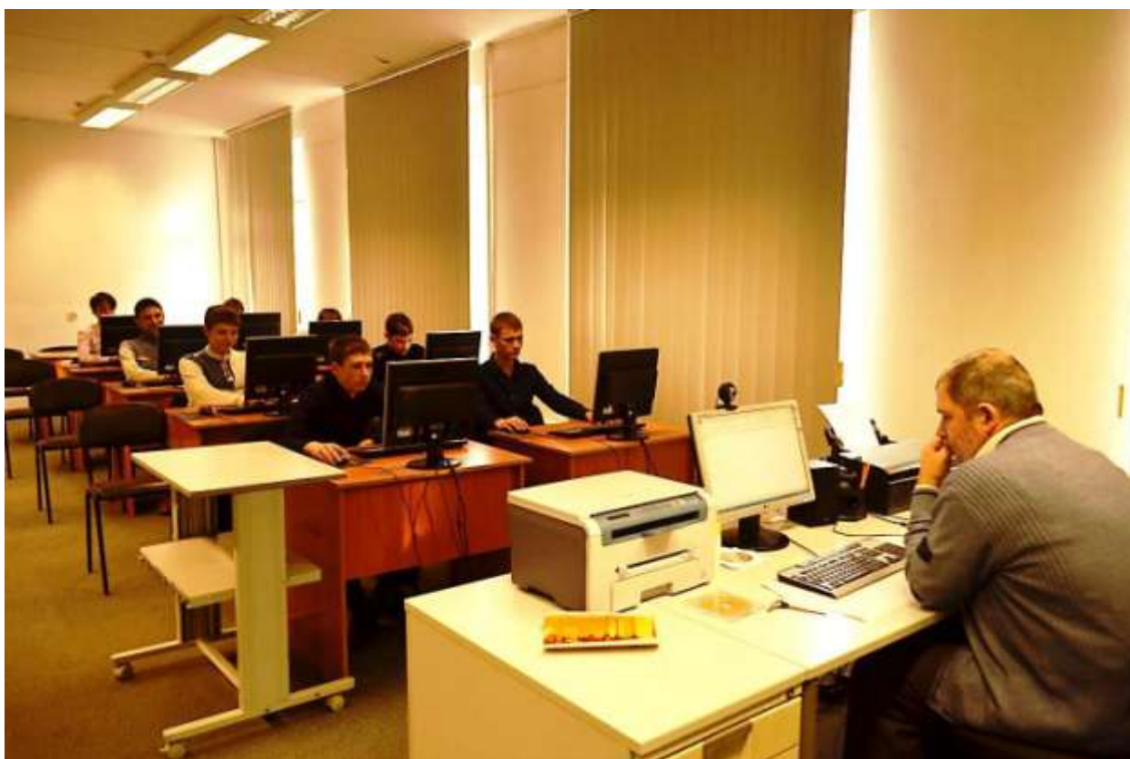
Комп'ютерний клас №1 для забезпечення дистанційного навчання