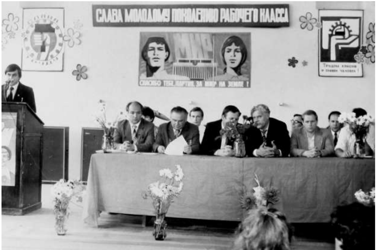
Посвята у робітники