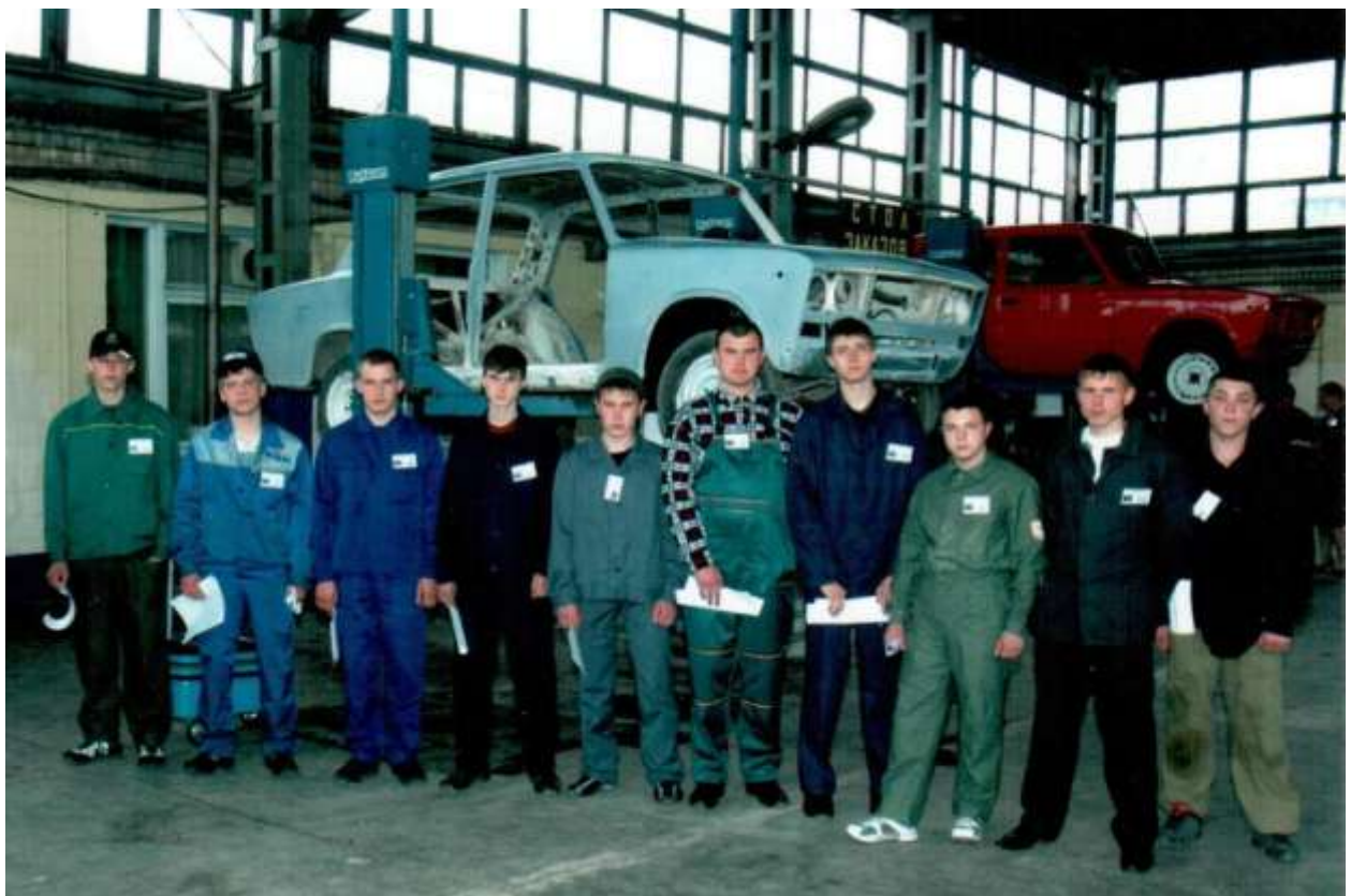
Конкурс професійної майстерності автослюсарів — майстрів з діагностики електронного устаткування автомобільних засобів