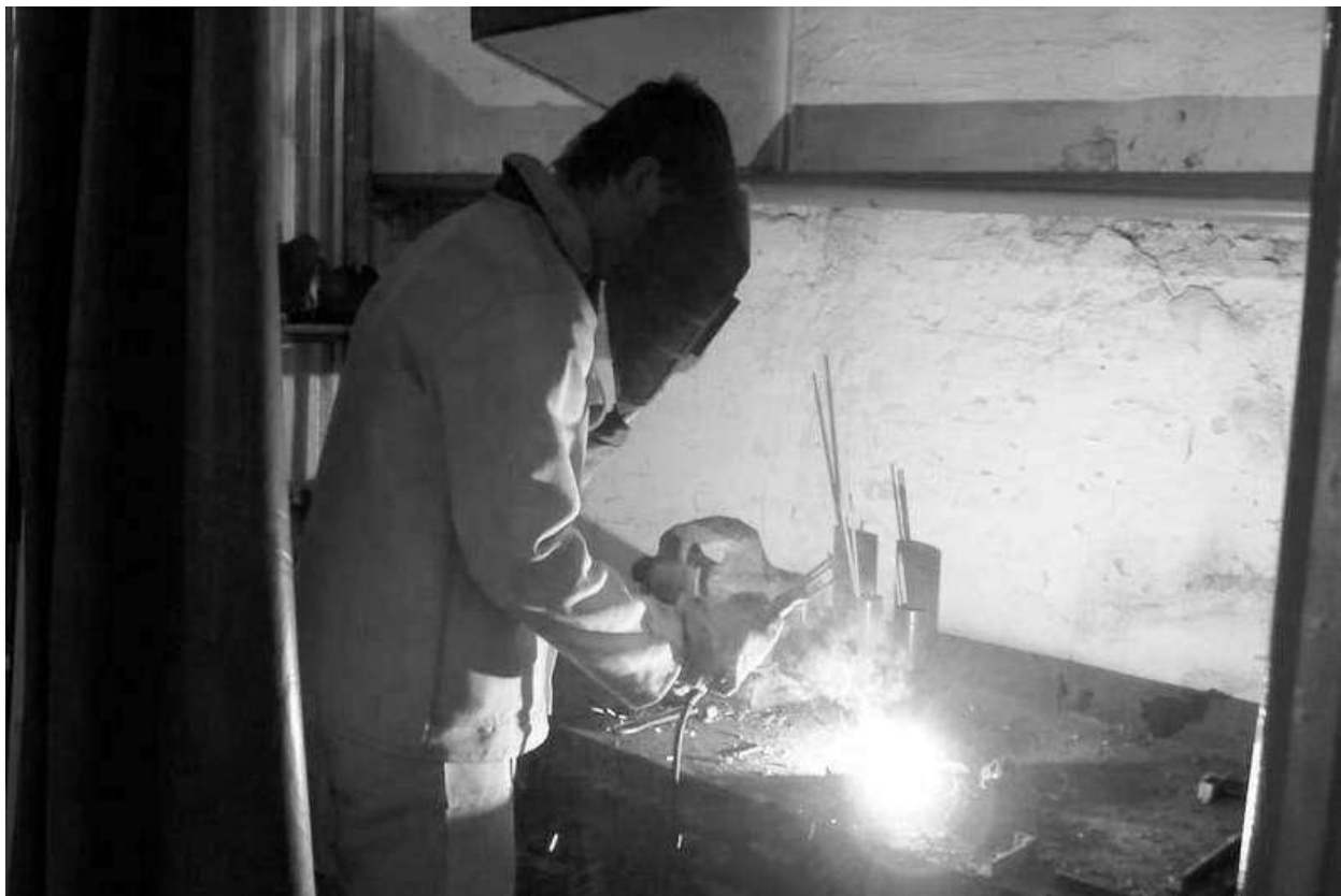
Урок виробничого навчання зварників