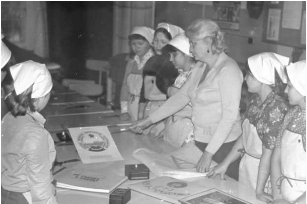
У швейній навчальній майстерні