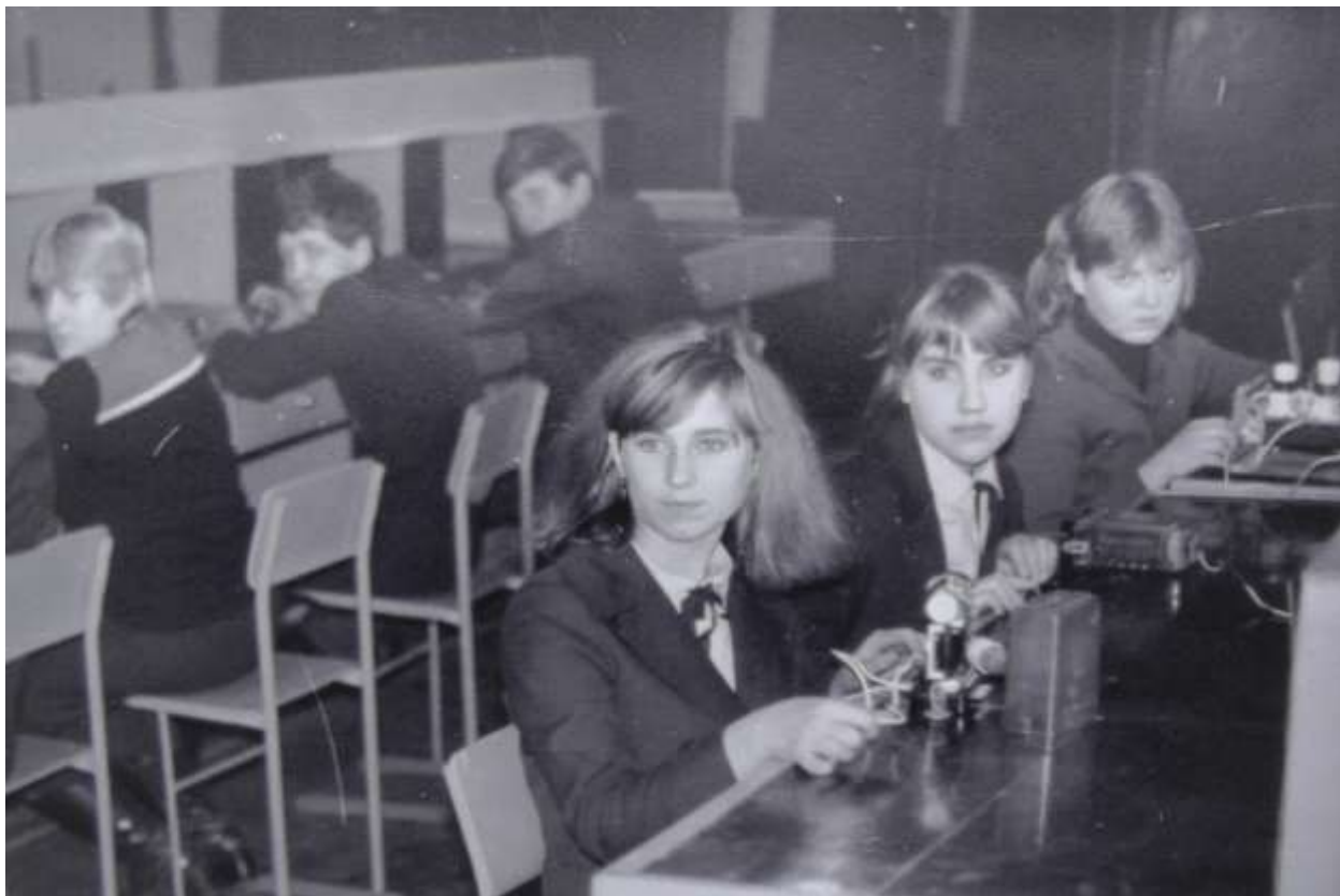
У майстерні підготовки електромонтерів