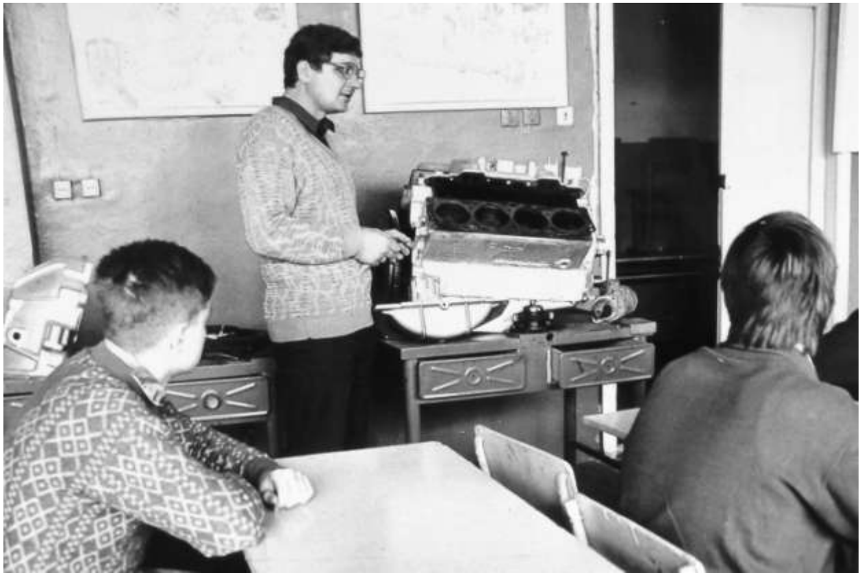
Під час виробничого навчання автослюсарів