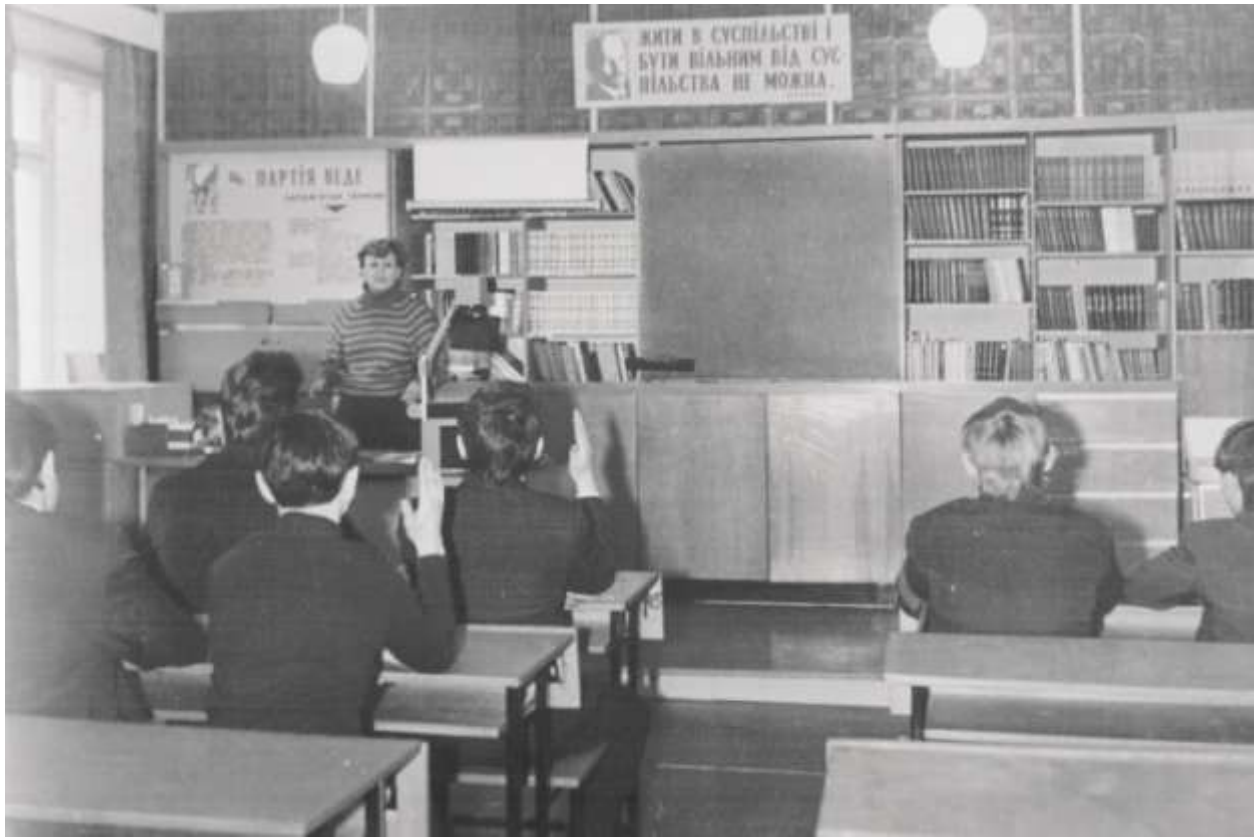
Кабінет української мови та літератури