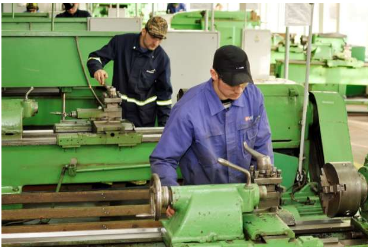
Набуття професійної майстерності у токарній майстерні