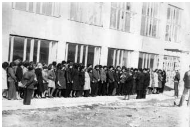
ТУ № 13. Перша урочиста лінійка