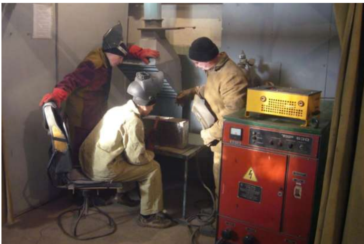
Сучасна майстерня з підготовки електрогазозварників