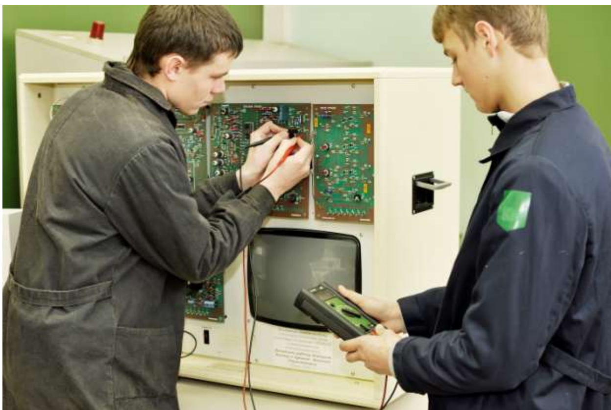
Професійне зростання на виробничому навчанні електромеханіків